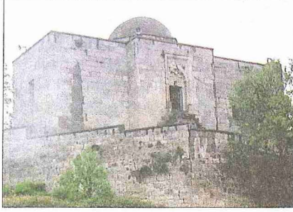
Cemâleddin Ferruh Dârülhadisi ve taçkapı kitâbesi ile muarnasları - Çankırı

Anadolu'da tesis edilen üçüncü dârülhadis Konya'daki İnce Minare Dârülhadisi'dir. Vezir Sâhib Ata Fahreddin Ali tarafından yaptırılan bu müessesenin bir sanat şaheseri olan binası günümüze kadar gelmiştir. Kitâbesi mevcut olmadığından yapılış tarihi konusunda farklı görüşler ileri sürülmüştür. Bunlardan 675 (1276) ve 678 (1279) yılları gerçeğe daha yakın görünmektedir. Medresenin dârülhadis olarak yapıldığı vakfiyesinden anlaşılmaktadır (Konyalı, Konya Tarihi , s. 813).