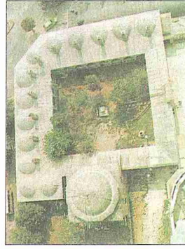
Selimiye Dârülhadisi'nin Selimiye Camii minaresinden görünüşü - Edirne

Yüksek pâyeli dârülhadislerin yapıldığı III. Murad devrinin başlıca dârülhadis-